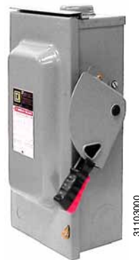
Figure / Figura / Figure 1 : Switch in the OFF (O) Position / Interruptor en la posición de abierto (O) / Interrupteur en position d'arrêt (O)